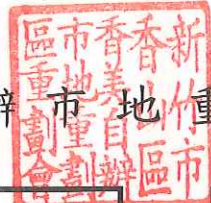
新竹市香山區香美自辦市地重劃區計算負擔面積總計表