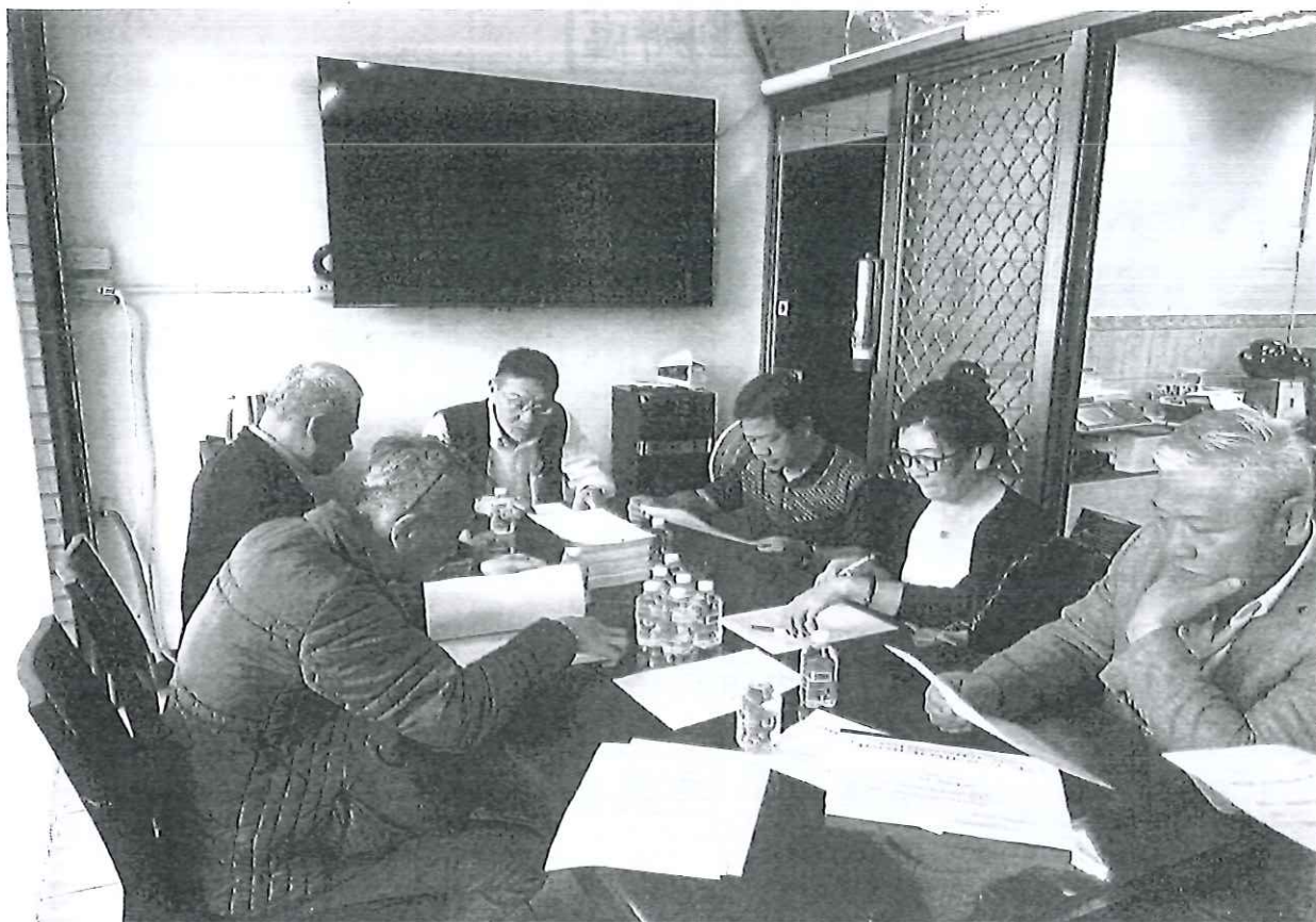
第 8 次理事會會議照片