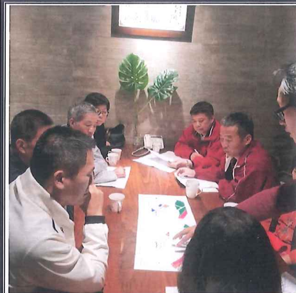
新竹市北區富美自辦市地重劃區重劃第四次理事會議照片